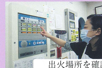
出火場所を確認！初期消火へ。