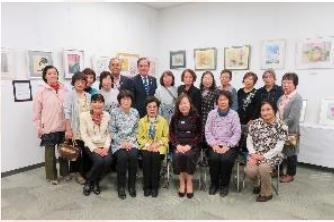
ちぎり絵・なごみ