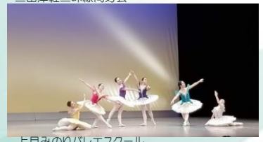
上月みのりバレエスクール