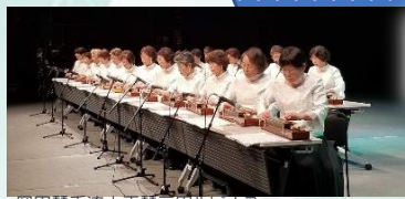
岡田琴十流大正琴三田ルビナス