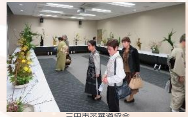
三田市茶華道協会