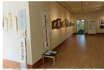
三田俳句協会・アメリカンシャドウボックス