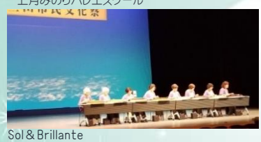
Sol & Brillante