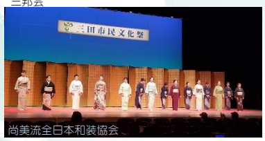
尚美流全日本和装協会