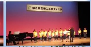
あかしあジュニア合唱団「さくらんぼ」