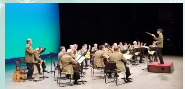
ゆりのきギタークラブ