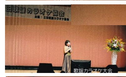
歌謡カラオケ大会