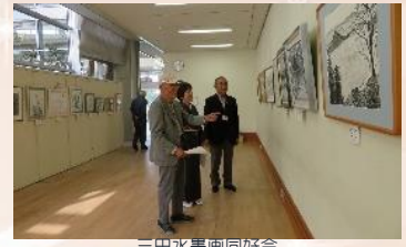
三田水墨画同好会