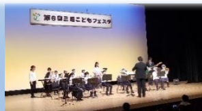
三田ジュニアバンド