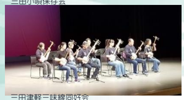
三田津軽三味線同好会