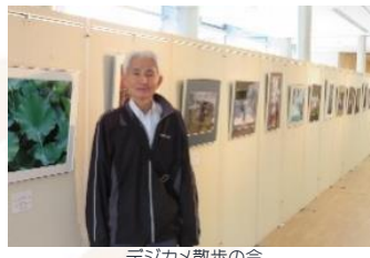
デジカメ散歩の会