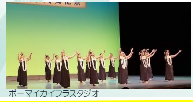
ポーマイカイプラスタジオ