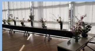
展示コーナー:三田茶華道協会