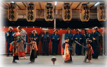
（平成31年度兵庫県阪神北ふるさと文化の伝承事業に認定）

三田市波豆川地区にある八坂神社で毎年秋祭り宵宮に豊作を祈って奉納される伝統文化で、江戸時代後期に歌舞伎の地方伝播とともに伝わったとされています。歌舞伎の格好に趣向を凝らした地域の子もたちが練り子となって行列を作り、忠臣蔵などの有名な歌舞伎の名場面を演じながら、波豆川公民館から八坂神社へと練り歩きます。平成3年、三田市無形民俗文化財に指定されました。例年10月の土曜日（「体育の日」の前々日）の19時に波豆川公民館を出発し、八坂神社へ向かいます。