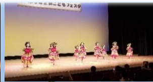
関口バレエスクール