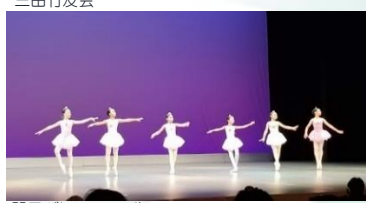
関口バレエスクール