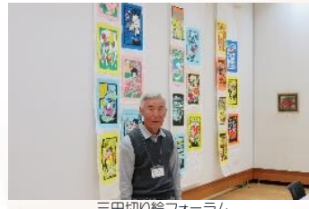
三田切り絵フォーラム