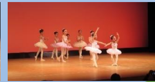
上月みのりバレエスクール