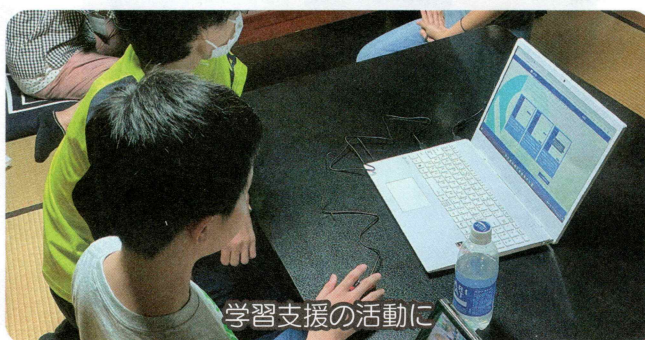
学習支援の活動に