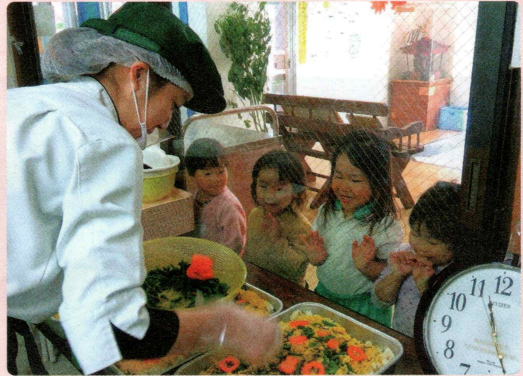
給食室のリフォームに 社会福祉法人呉竹会 児玉の森こども園(本庄市)