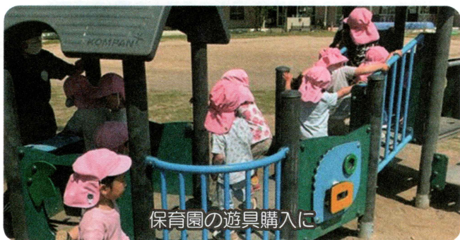
保育園の遊具購入に