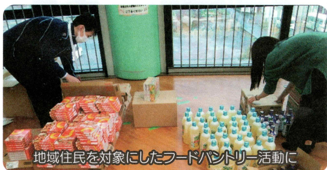
地域住民を対象にしたフードパントリー活動に