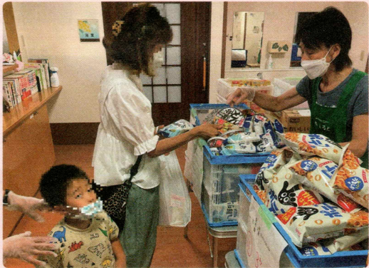
フードパントリー活動に 特定非営利活動法人フードバンクいるま(入間市)