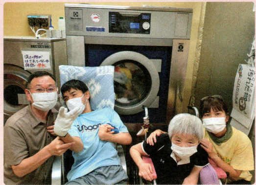
大型洗濯機の購入に 社会福祉法人みぬま福祉会 大地(蓮田市)