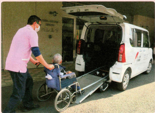
スロープ付き車両の購入に 社会福祉法人ハレルヤ デイサービスセンターハレルヤ(朝霞市)