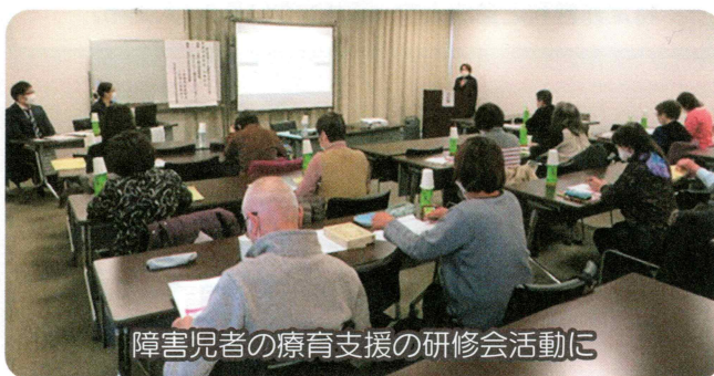
障害児者の療育支援の研修会活動に