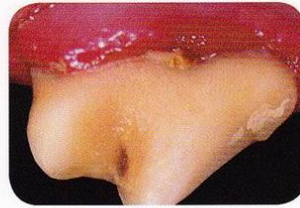
Stage 3: Moderate periodontal disease