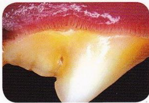
Stage 1: Gingivitis