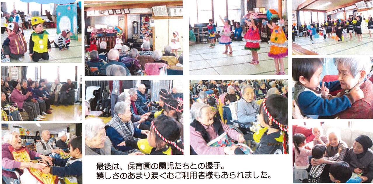
最後は、保育園の園児たちとの握手。 嬉しさのあまり涙ぐむご利用者様もおられました。

11月30日（金）黒川保育園の園児が来苑。可愛くてカッコイイ踊りを見せていただきました。