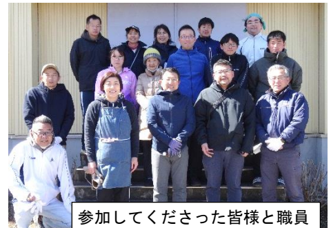
参加して下さった皆様と職員

※ 令和6年度 藤塚小だより4月号は、新学期が始まる4月8日以降に配付予定です。