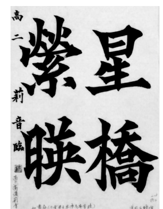
如恵会(千葉) 高2 高濱 莉音 唐の歐陽通の「道因法師碑」の特徴である厳しい線質と引き締まった字形による作品は、爽やかな気分を感じさせます。