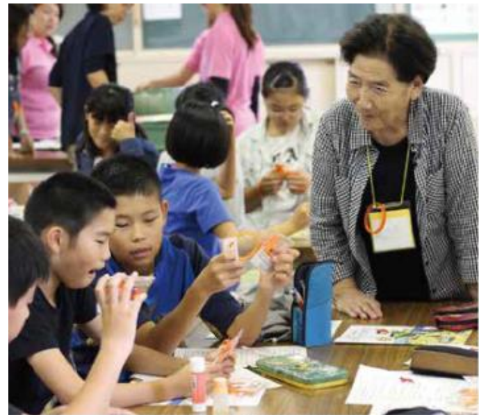
マスコットを作成する活動のサポーターも