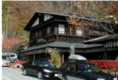
太宰治がここに逗留中に「富士には月見草がよく似合ふ」と富嶽百景に書いた。