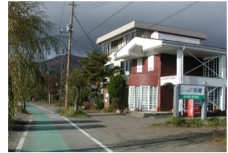
ゴール レークピア岳麓