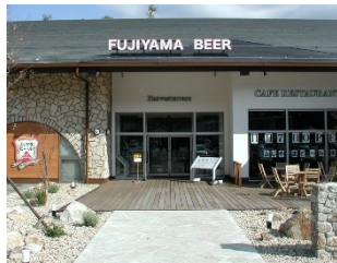
2CP 道の駅 富士吉田 地ビール富士山ビールはここで醸造。