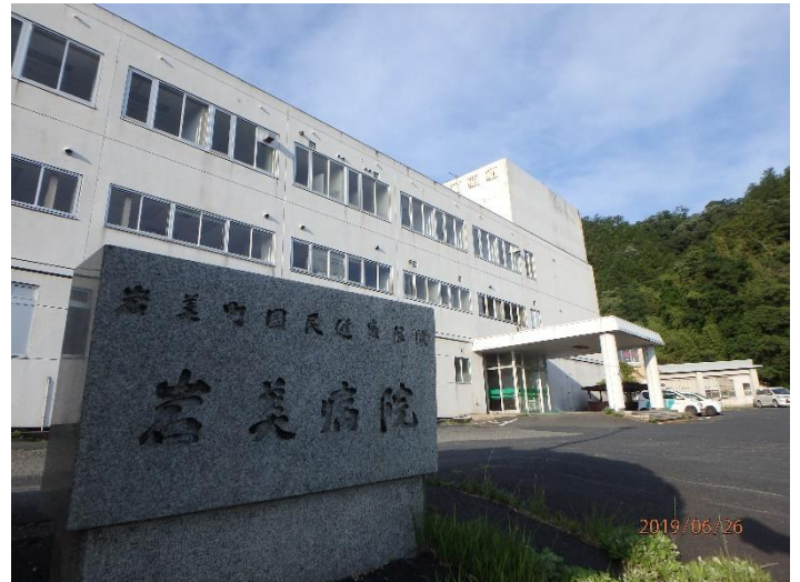
(R01.06.26 旧岩美病院で海拔 mぐらい? 現代美術の作成・展示や選挙時に使用する机や椅子の倉庫として利用) モル10 P3