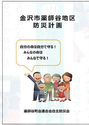
全戸配布しました

起きて欲しくない災害ですが、事前の備え、また起きた際の対応。それらのことを一年以上にわたり検証し、討議し、指針としてまとめた地区防災計画がこのたび策定され、各町会に備えていただくことになりました。ダイジェスト版を地区の全家庭に配布いたしました。