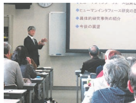
写真：講演会の様子

今回は、まず各所長がそれぞれの学習センターの概要ならびに地域に密着した面接授業を紹介するとともに、あわせて奈良SC・大阪SCの所長から講演が行われました。その後、近畿ブロック各センターの連携のあり方について、聴衆を交えて、茶話会形式で、熱心な議論が行われました。次回の近畿ブロック連携所長公開講演会は、京都学習センターで開催の予定となっています。