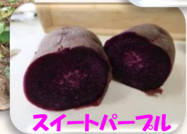
スイートパープル