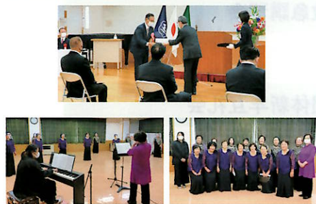
コール若葉の皆さん