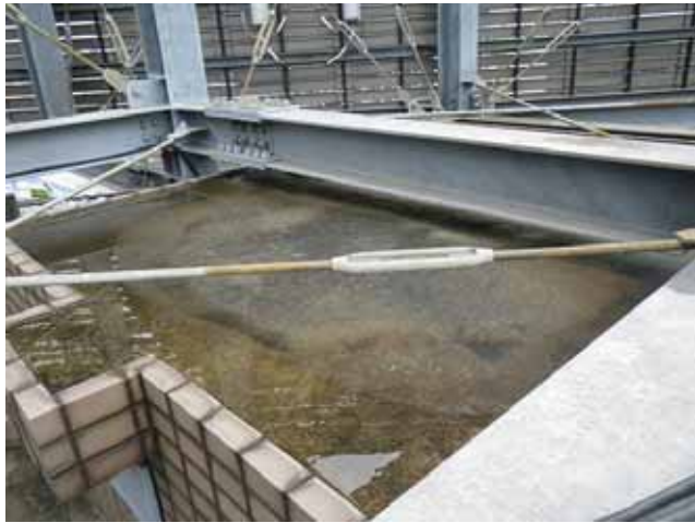
EVシャフト屋根:全景

現在、漏水等の不具合は無く防水機能は維持されていると考えられますが、経年や予防保全・防水機能維持の観点から防水層の更新が望まれます。