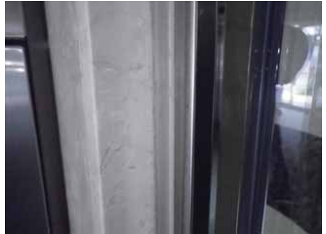
部 位: エントランス扉廻り目地 状 況: 汚れ