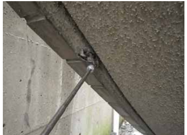
外部階段 上裏:爆裂