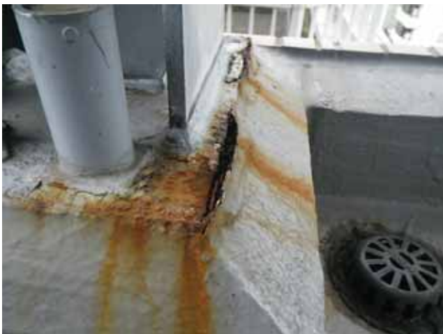
架台：塗膜剥離・錆汁の析出