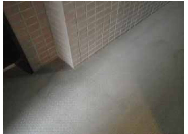
共用廊下 床面:経年による汚れ