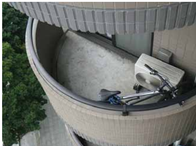
バルコニー:表層の風化

劣化の進行や不具合発生を防ぐ為にも、予防保全の観点から防水改修の計画・検討が望まれます。