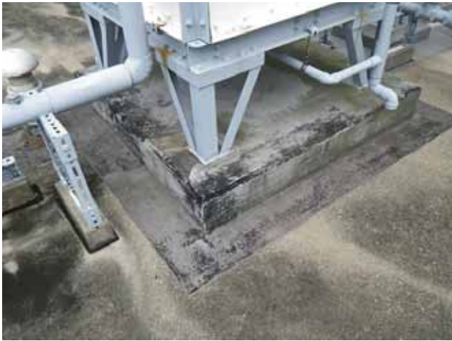
架台：保護塗料の退色

劣化の進行や不具合発生を防ぐ為にも、予防保全の観点から防水改修の計画・検討が望まれます。