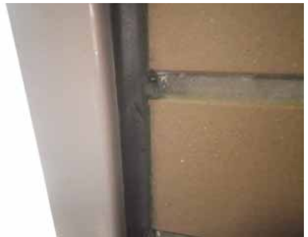
部 位：PS扉廻り目地 状 況：汚れ