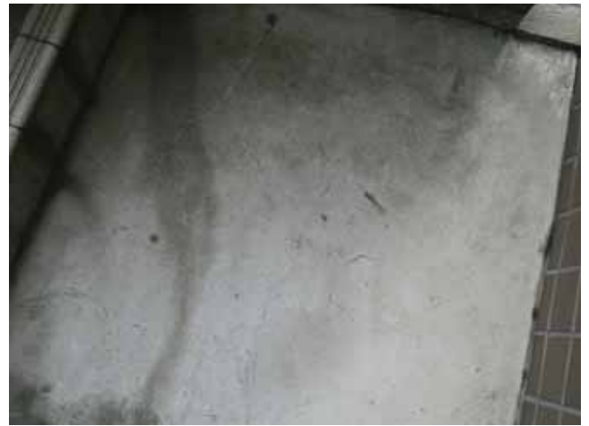
外部階段 踊場:表層の風化