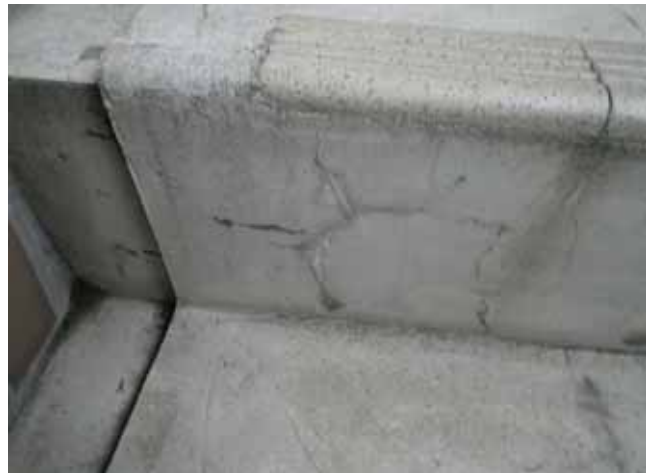
外部階段 蹴上:亀甲ひび割れ