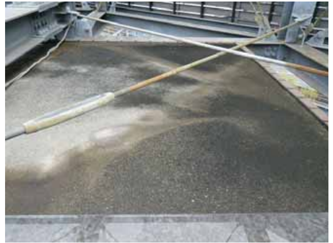
EVシャフト屋根 平場:表層の風化