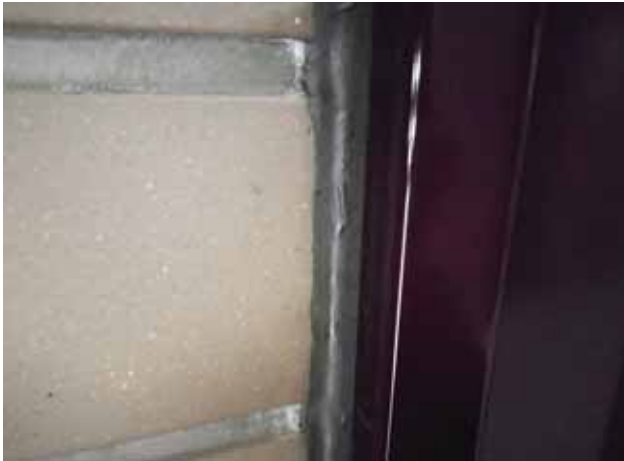
部 位: EV扉廻り目地 状 況: 汚れ