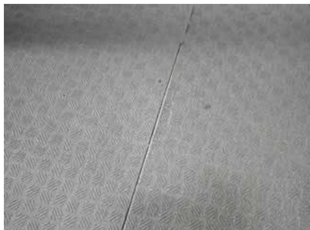
共用廊下 床面:溶接棒の剥離