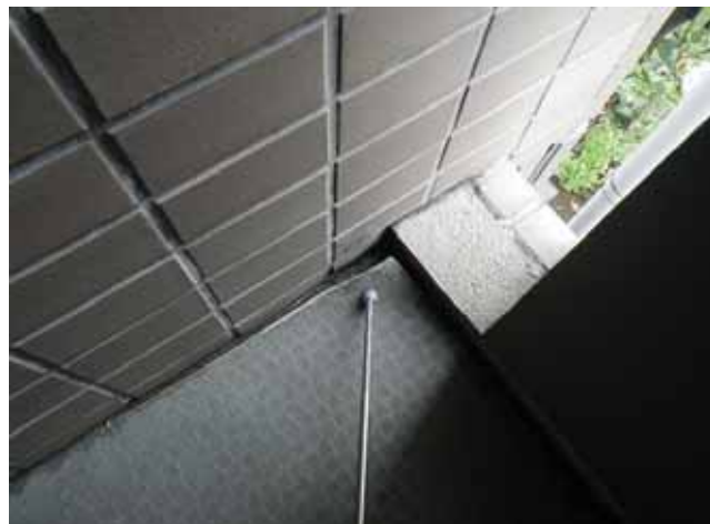
共用廊下 床面:シートの浮き