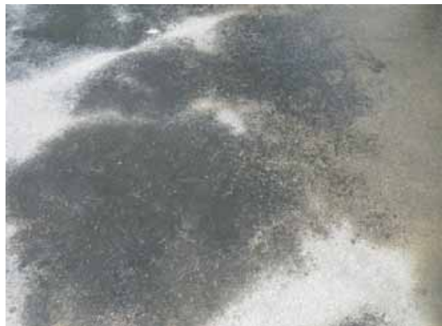
屋上 平場:表層の風化