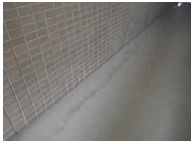
共用廊下 床面:雨染み汚れ