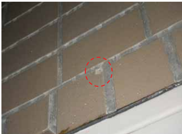
共用廊下 内壁:欠損