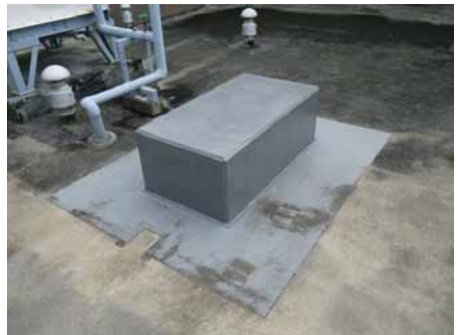
架台(ウレタン部)：保護塗料の退色