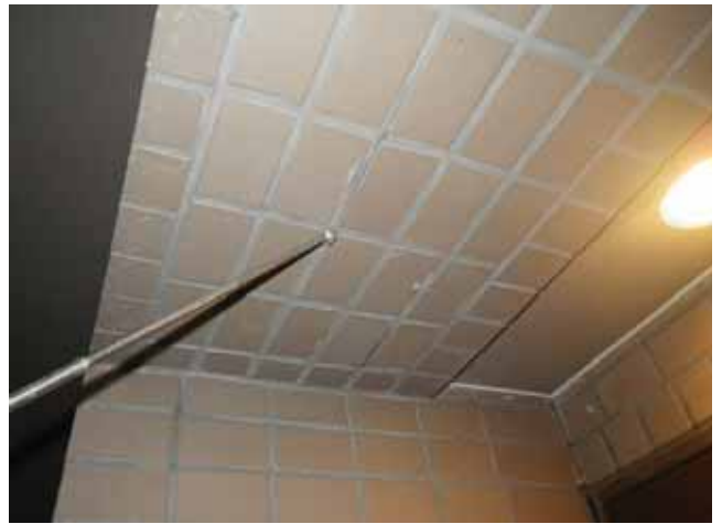
共用廊下 梁下:タイルの浮き