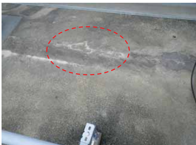
屋上 平場:エフロレッセンス