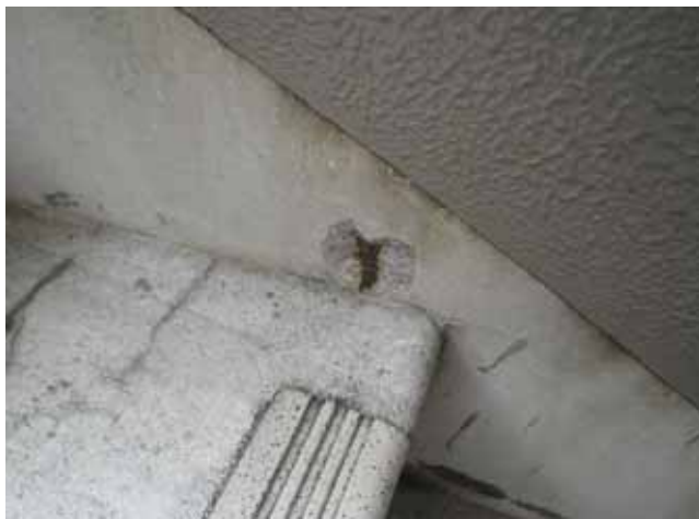
外部階段 巾木:鉄筋爆裂