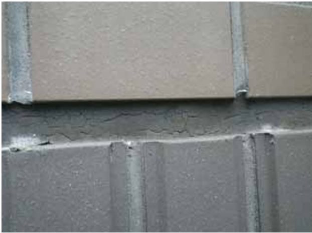
部 位：打継目地 状 況：ひび割れ

今後、物性面が低下すると、シーリング材は硬化し破断等の漏水原因に繋がる事が懸念されますので、計画的な修繕工事(打替え工事)を行う事が必要と考えられます。尚、シーリング材の補修については、足場架設が必要である為、大規模修繕工事にあわせて改修することが望まれます。