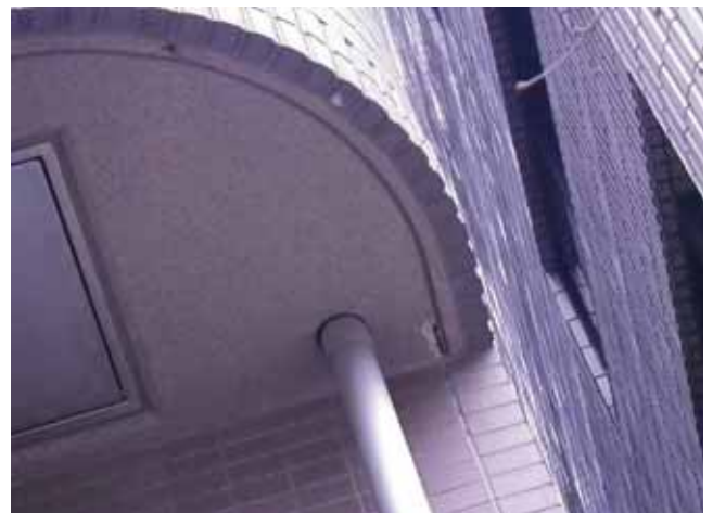
バルコニー 上裏:鉄筋爆裂