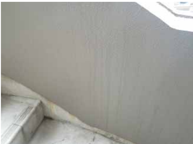
外部階段 手摺内壁:雨筋汚染