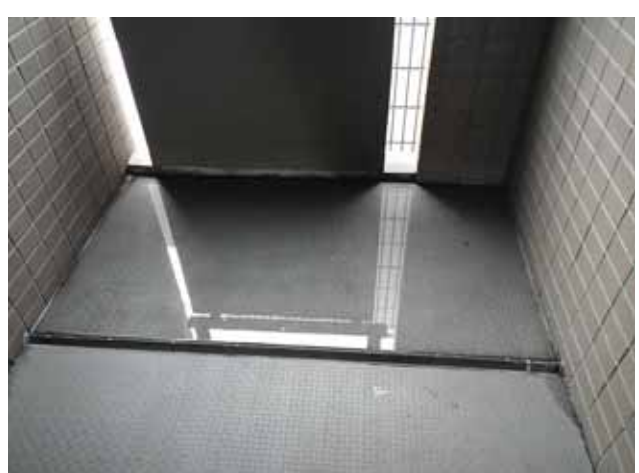
共用廊下 床面:滞留水