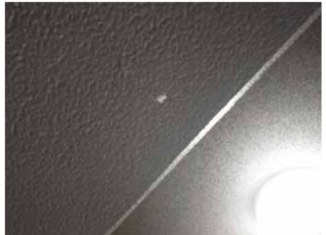
共用廊下 梁下:塗膜剥離