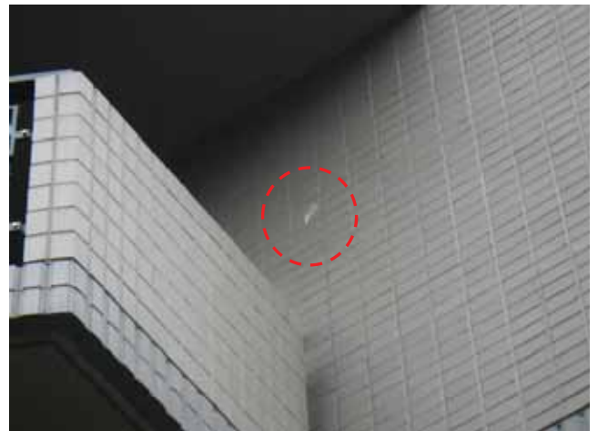
外壁:エフロレッセンス