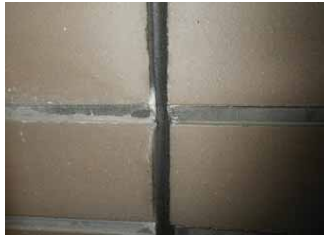
部 位：タイル目地 状 況：汚れ