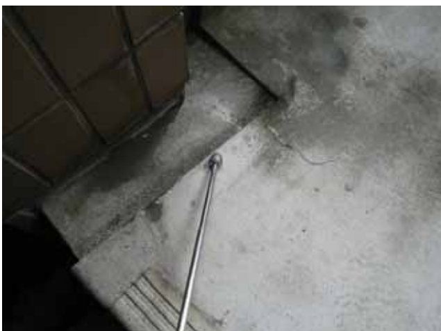
外部階段 踊場:モルタルの浮き