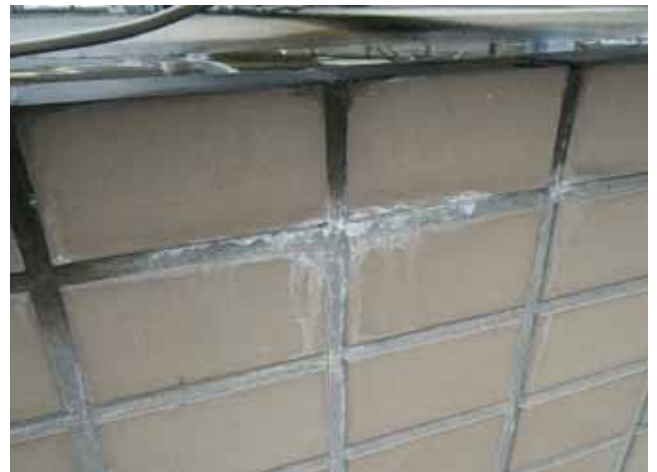
屋上 外壁:エフロレッセンス