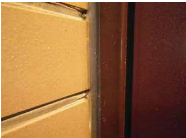
部 位：玄関扉廻り目地 状 況：汚れ