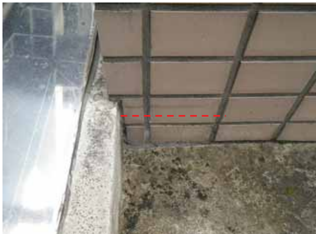
屋上 外壁:タイルのひび割れ