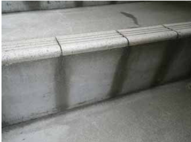
外部階段 蹴上:雨染み汚れ