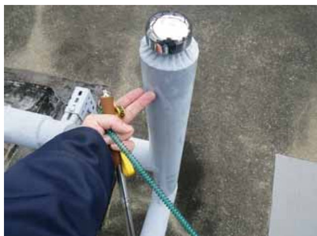
設備配管：チョーキング