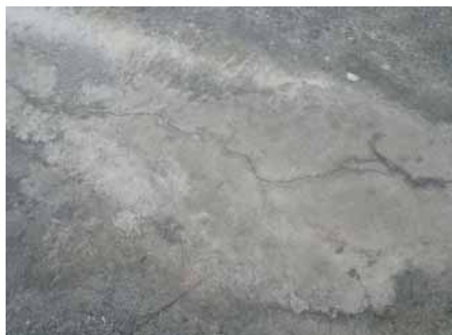
屋上 平場:ひび割れ