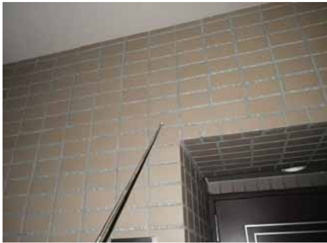
共用廊下 内壁:タイルの浮き