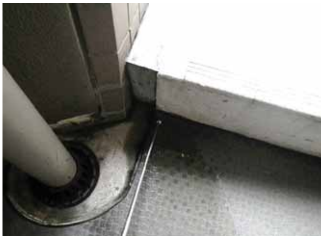
共用廊下 床面:シートの浮き