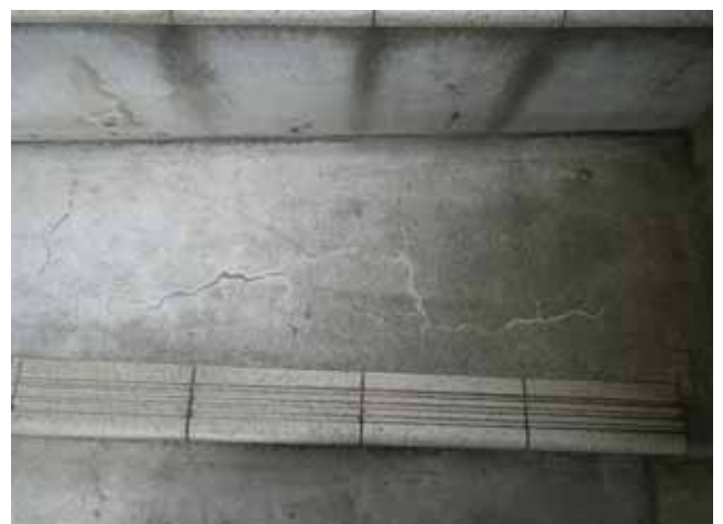
外部階段 踏面:亀甲ひび割れ