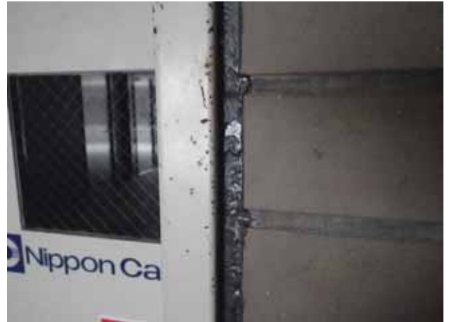
部 位: 鋼製扉廻り目地 状 況: 軟化現象