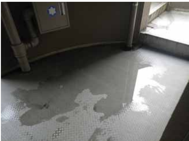
共用廊下 床面:滞留水