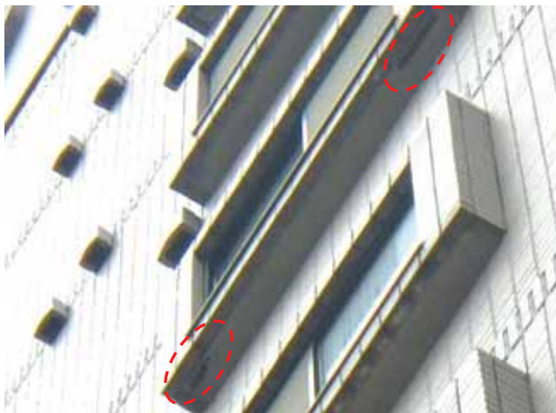
出窓 上裏:鉄筋爆裂