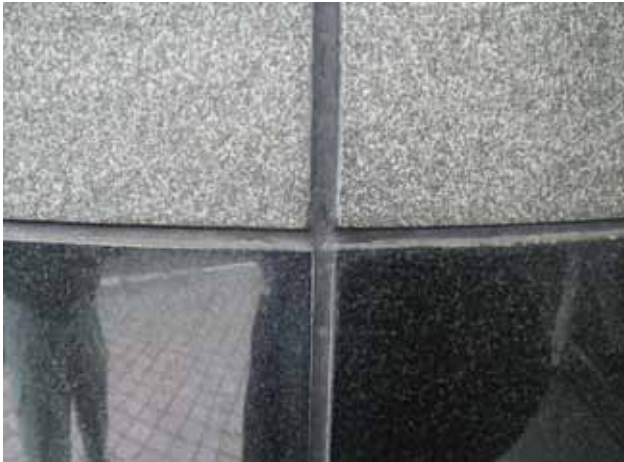
部 位: エントランス石目地 状 況: 軟化現象