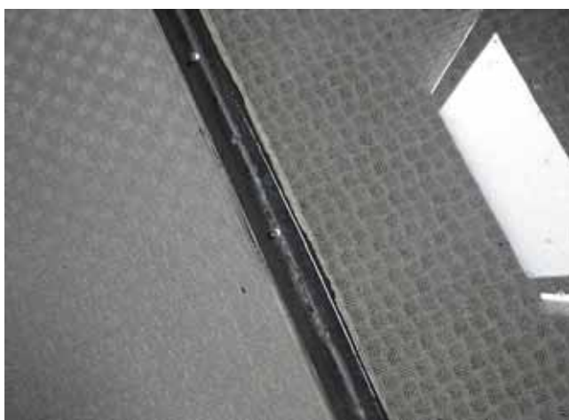
共用廊下 床面:接合部の剥離