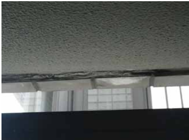
共用廊下 上裏:エフロレッセンス