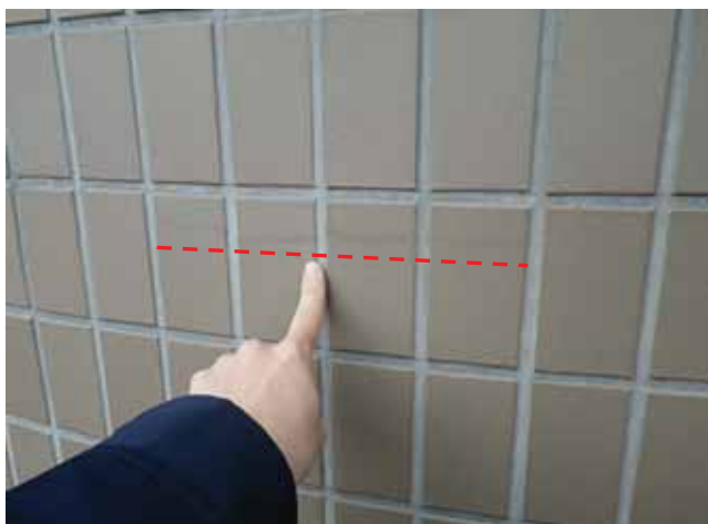
外部階段 内壁:タイルのひび割れ