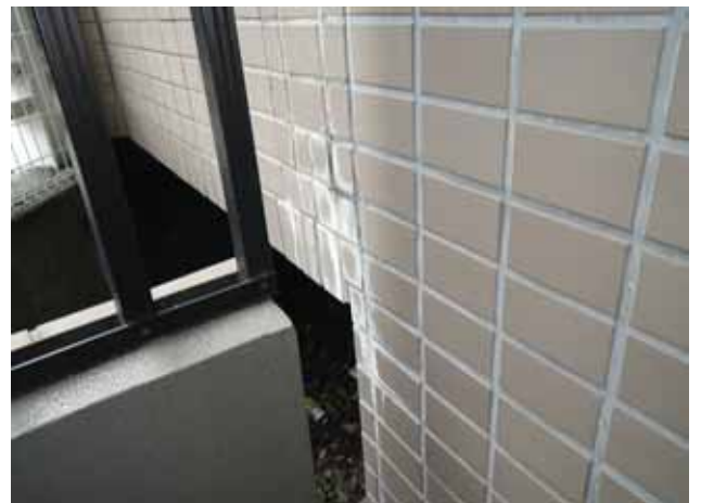
外部階段 外壁:エフロレッセンス