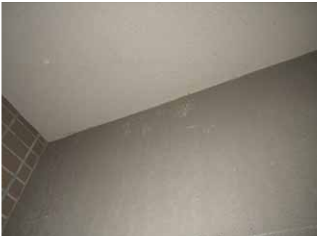
共用廊下 内壁:経年による汚れ

大規模修繕の際には適切に下地補修を実施し、美観性の回復・躯体コンクリートの保護を考慮し、塗装の更新を行うことが望まれます。