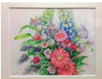
※講師:千田 和世 作品

1回の体験講座でF6号の作品を1枚完成させます。丁寧に分かりやすく指導しますので、初めて学ばれる方におすすめの講座です。画材はこちらで用意いたしますので、お気軽にご参加ください。